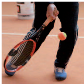
Der Trainer zeigt verschiedene Schläge.

Man sucht ein Hobby. Man muss nur die Lübbecke Tennisplätze betreten und man ist begeistert. Die Kinder, Jugendlichen und Erwachsenen spielen mit einem Selbstvertrauen, Spaß, einer solchen Lebendigkeit und Entschlossenheit, dass man sich denkt: „Das ist mein Sport!“