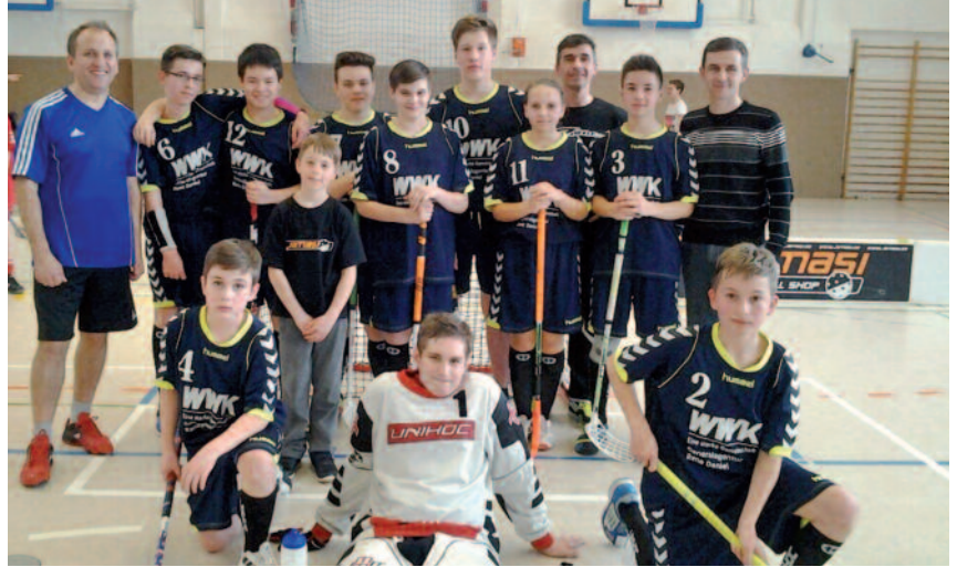
Das Team freut sich über den vorzeitigen Titelgewinn